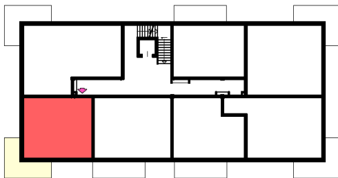
Rzut kondygnacji 1 Piętro

Ściany działowe nadające się do demontażu